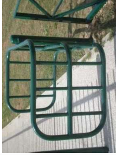
Passage sélectif PMR aux entrées