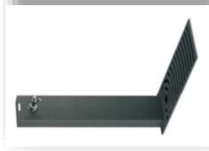
1 Fontaine à boire