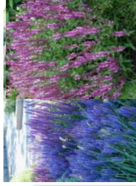
Sauge des bois