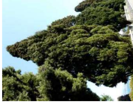
Cyrés ( Cupressus semp. )