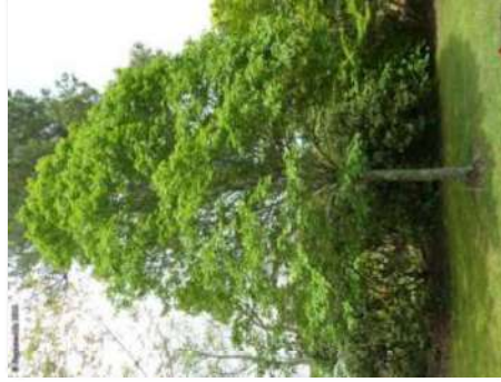
Erable champêtre ( Acer campestre )