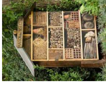
Nichoires et abris faune sauvage

(hôtels à insectes réalisés avec l'association Les Petites Choses, 6 nichoires oiseaux fabriqués par les collégiens du collège Mistral et de l'école saint Roch )