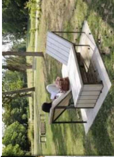
Mobilier de pique-nique et détente