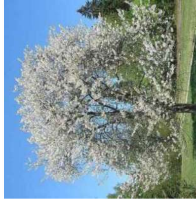
Merisier ( Prunus avium )