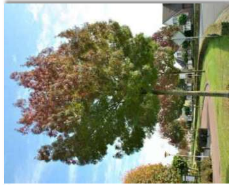
Frêne à feuilles étroites ( Fraxinus angustifolia )