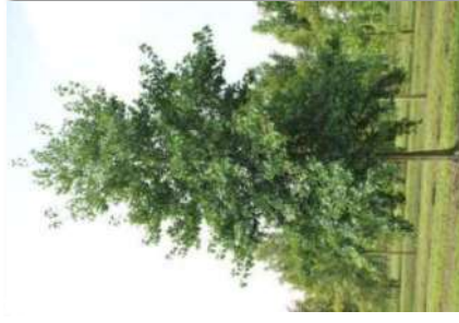
Aulne ( Alnus cordata )