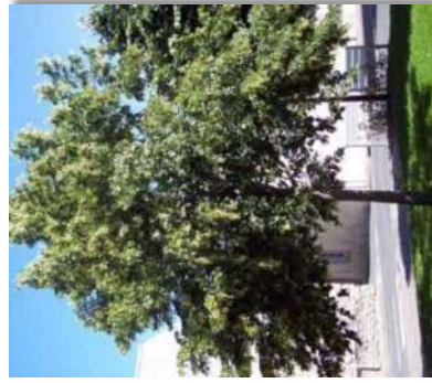
Tilleul à petites feuilles ( Tilia cordata )