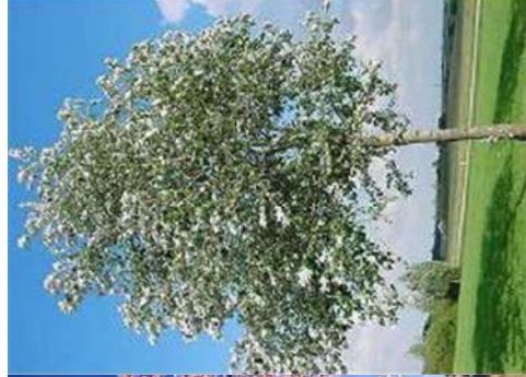
Peuplier blanc Populus alba