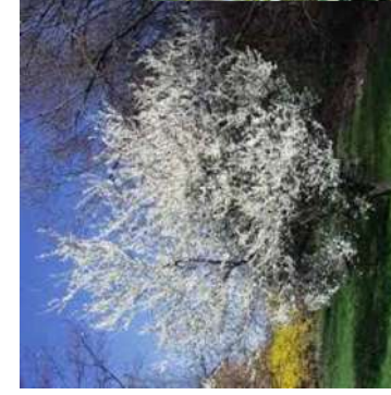
Mirabellier Prunus domestica