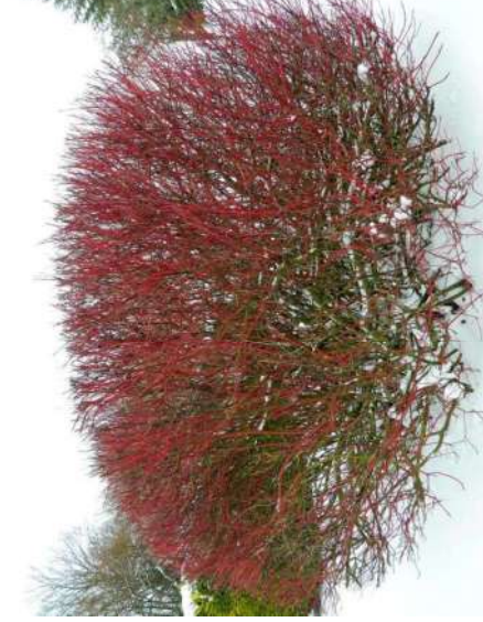
Cornouiller sanguin Cornus sanguinea

Développement rapide, port naturel, résistance aux conditions climatiques, entretien limité