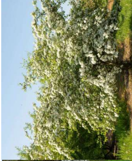
Aubépine Crataegus monogyna