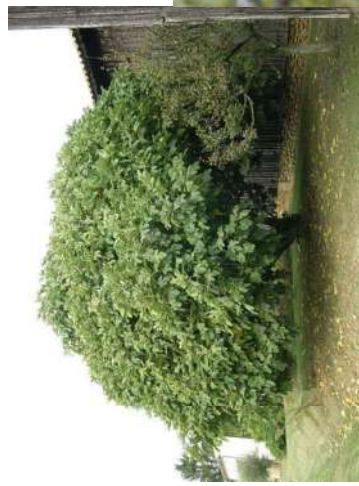
Figuier Ficus carica