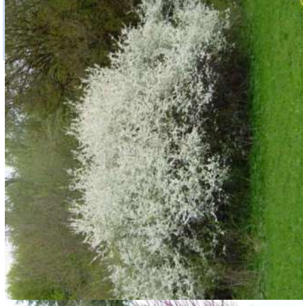
Prunellier Prunus spinosa