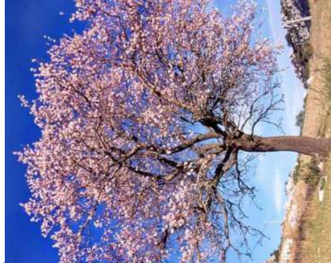
Amandier Prunus dulci