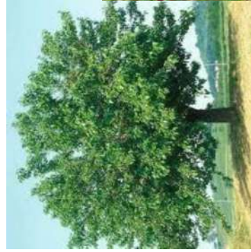
Murier blanc Morus alba