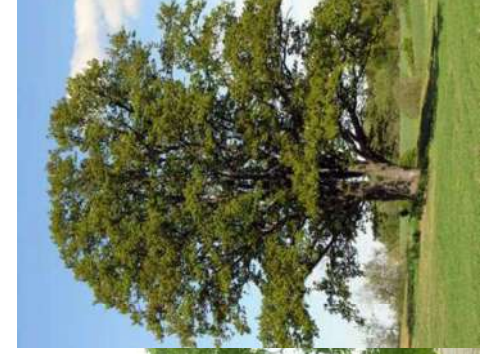
Chêne pédonculé Quercus robur