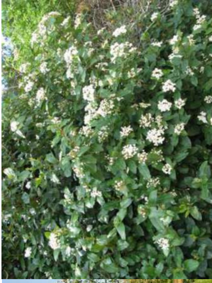
Laurier tin Viburnum tinus