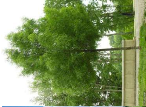
Frêne du Midi Fraxinus angustifolia Raywood