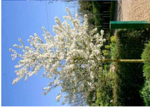
Pommier d'ornement Malus Everest

Arbres et cépées à moyen et grand développement, comestibles, utiles aux oiseaux et d'ambiance de bord de Canaux