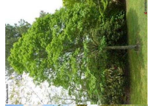
Erable Champêtre Acer campestre