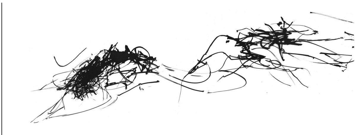
Encre de chine sur calque 140*80. 20 min .Toit terrasse de la friche

Il s'agit avant tout d'aller vers une économie de moyen, de faire avec ce qui est présent pour en dévoiler la poésie. Comme pour un jardin ou un espace public, « c'est le regard qu'on porte sur ce qui nous entoure qui motive ma création ».