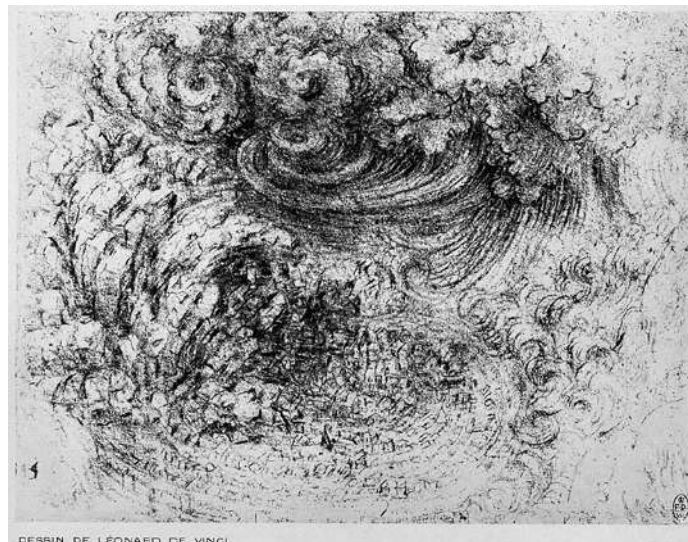
Extraits du manuel de dessins de Léonard de Vinci