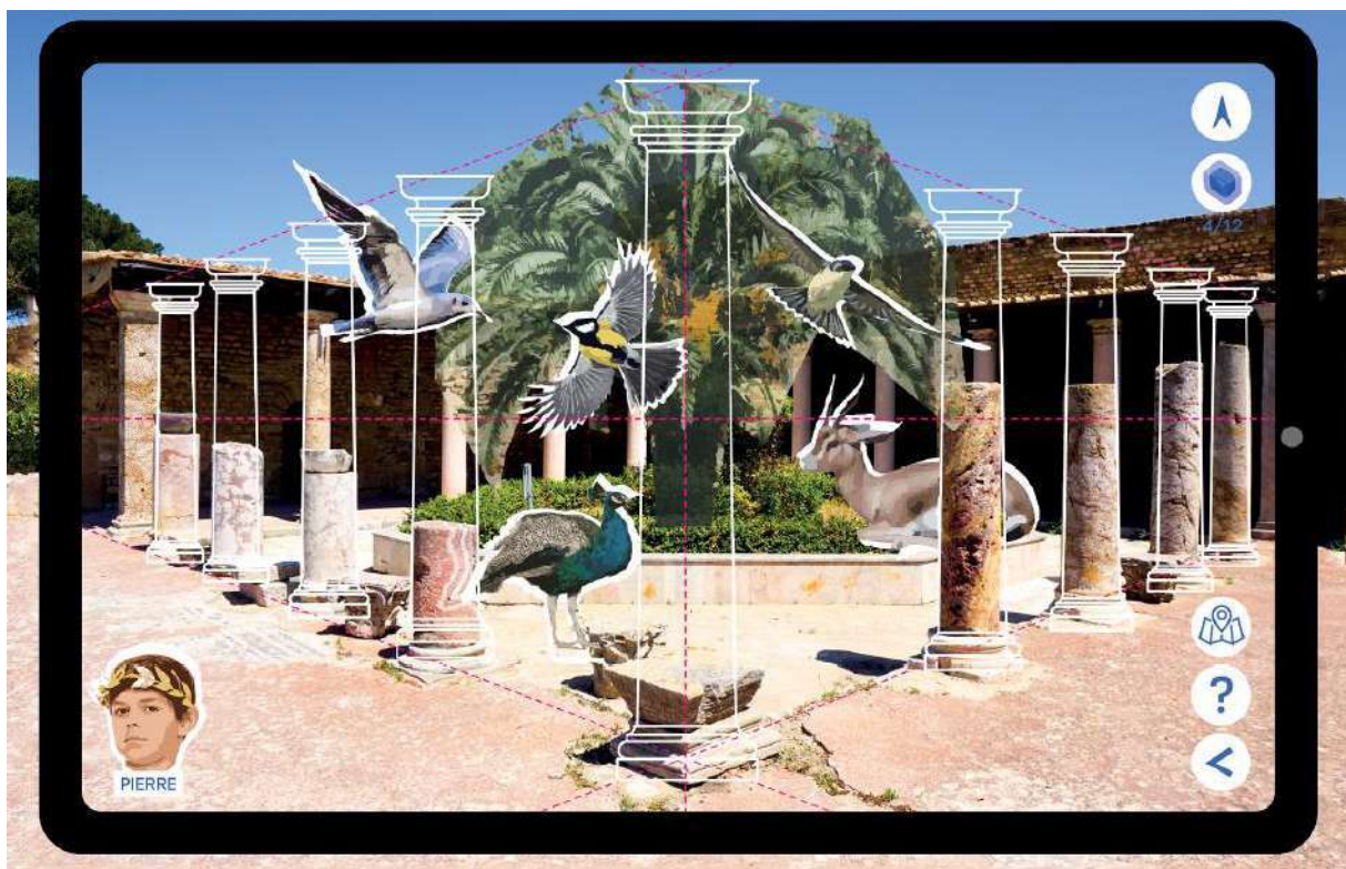
Restitution en réalité augmentée du péristyle avec la mosaïque de la Jonchée à Carthage

Volubilis est une ONG engagée à l'échelle méditerranéenne sur les questions de la ville, des paysages et de l'aménagement soutenable des territoires. Elle mène des projets sur les questions émergentes et les projets innovants et exemplaires autour de la problématique du « vivre, rêver et faire la ville et les paysages contemporains ».